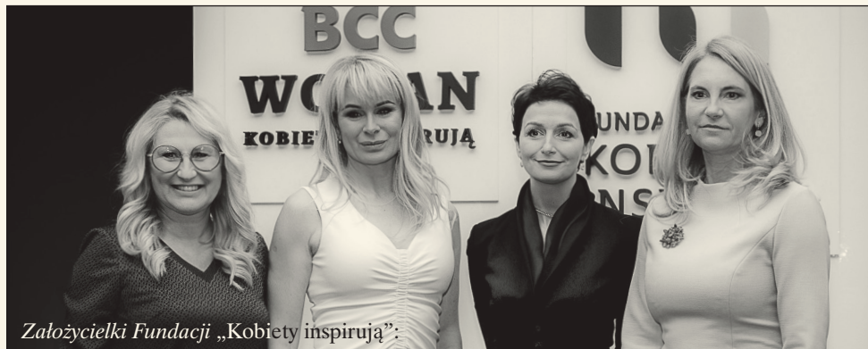
Założycielki Fundacji „Kobiety inspirują”: