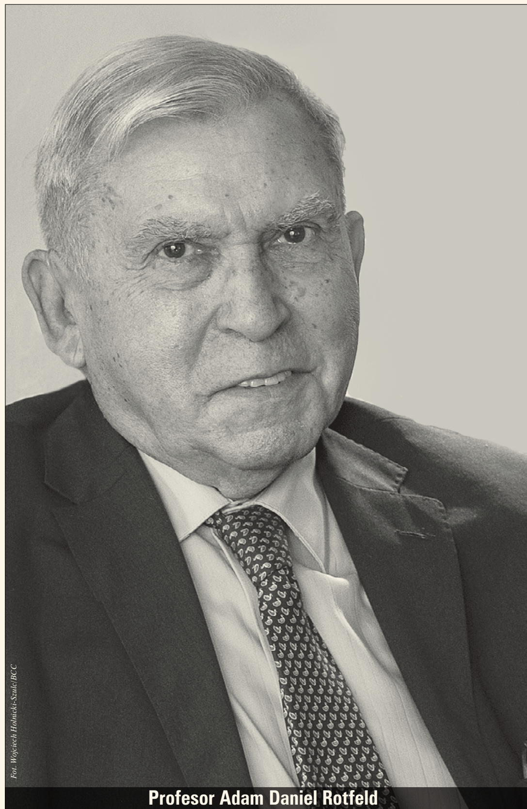
Profesor Adam Daniel Rotfeld

Wręczenie nagród podczas Wielkiej Gali Liderów Polskiego Biznesu