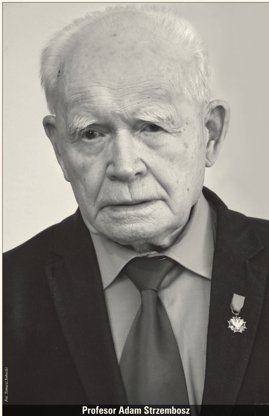
Profesor Adam Strzembosz

Nauczyciele akademicy wielu pokoleń młodych Polaków. Uhonorowani najwyższymi odznaczeniami państwowymi.