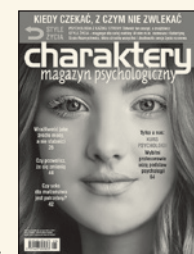
Fragment rozmowy „Mięsień spokoju”, która ukazała się w magazynie Charaktery 1/2018.

– Moim zdaniem prawdziwa wartość medytacji polega na tym, że jest ona przeciwieństwem pozytywnego myślenia. To trening umysłu, który pokazuje nam, jak być obecnym tu i teraz, przy naszych myślach i emocjach, zamiast rozpaczliwie próbować pozbyć się tego, co negatywne. Sam uczestniczyłem w tygodniowym odosobnieniu. Na początku medytacja była okropnym doświadczeniem. Kiedy próbowałem wyciszyć swój umysł, okazywało się, że jest on bardzo głośny i pełen nonsensów. Im dłużej trwało odosobnienie, tym jaśniejsze stawało się dla mnie, że jego celem nie było wyciszenie umysłu. Chodziło o to, by tam po prostu być; i bez względu na to, jak wielki zgiełk towarzyszy nam w środku, nie poświęcać mu za dużo uwagi. Gdy udało mi się to osiągnąć, w mojej głowie zrobiło się znacznie ciszej.