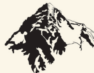
K2 - CHHOGORI

Drugą podstawową trudność stwarzają temperatura i wiatr. Całkiem znośną wspinaczkową normą jest minus 20-30 stopni, wicher zaś – gdy już wieje – często osiąga prędkość ponad 100 km/h. Andrzej Zawada – legenda polskiego