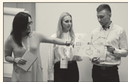
Podczas pracy – Konwent w Krakowie

Trwają prace nad czterema sztafardowymi projektami – Festiwal BOSS, Biznes Junior, Najlepsze Zajęcia z Przedsiębiorczości i Przedsiębiorca Kobieta, które będą realizowane w marcu i kwietniu. W wielu regionach odbędą się również wydarzenia dotyczące inteligencji finansowej oraz autorskie projekty regionalne, takie jak Art Business Festi-