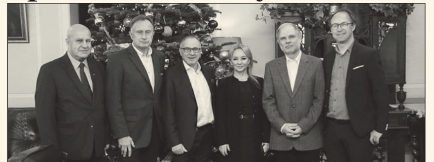
Goście i członkowie Komisji Sportu i Turystyki BCC

Komisja Sportu i Turystyki BCC podsumowała najważniejsze wydarzenia sportowe, które odbyły się w 2017 roku oraz omówiła najciekawsze wydarzenia planowane w 2018 r.